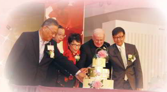
「第一屆 CMAC 夫妻節」揭幕儀式