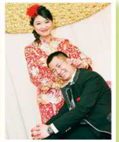
我最 Like 爆獎

若想觀看比賽作品或是重溫這份喜悅，可到以下網址 https://www.facebook.com/hkcmac 瀏覽，機不可失啊！